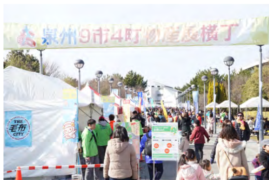
＜昨年の物産展エリアの様子＞