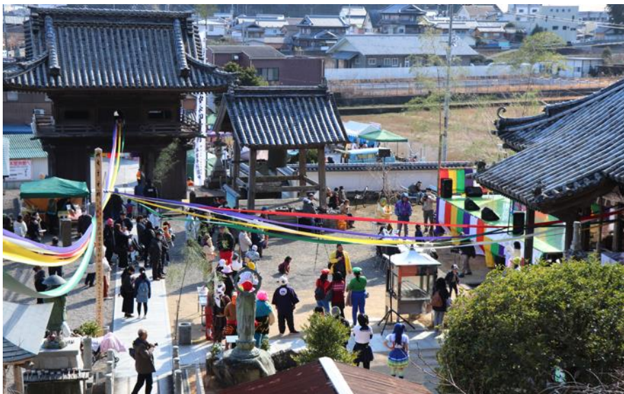
仮面初会式 仮装コンテストの様子

平等寺は、地域の活性化に力を入れており、お寺で行事やイベントを行うことで、地域の人々が集い、多くの方が交流を通して、楽しい時間を共有できる場を提供しています。